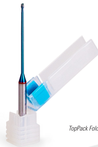
TopPack FoldBack PLUS