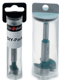
base du tube renforcé